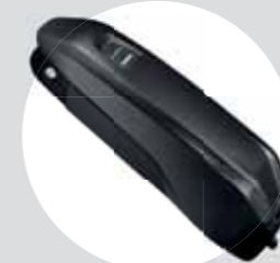
RAHMEN-AKKU BT-E8010, BT-E8014 + AKKUHALTER BM-E8010