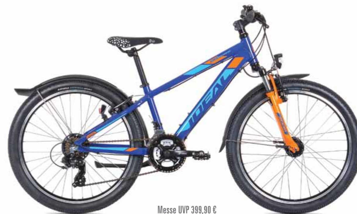
Messe UVP 399,90 €