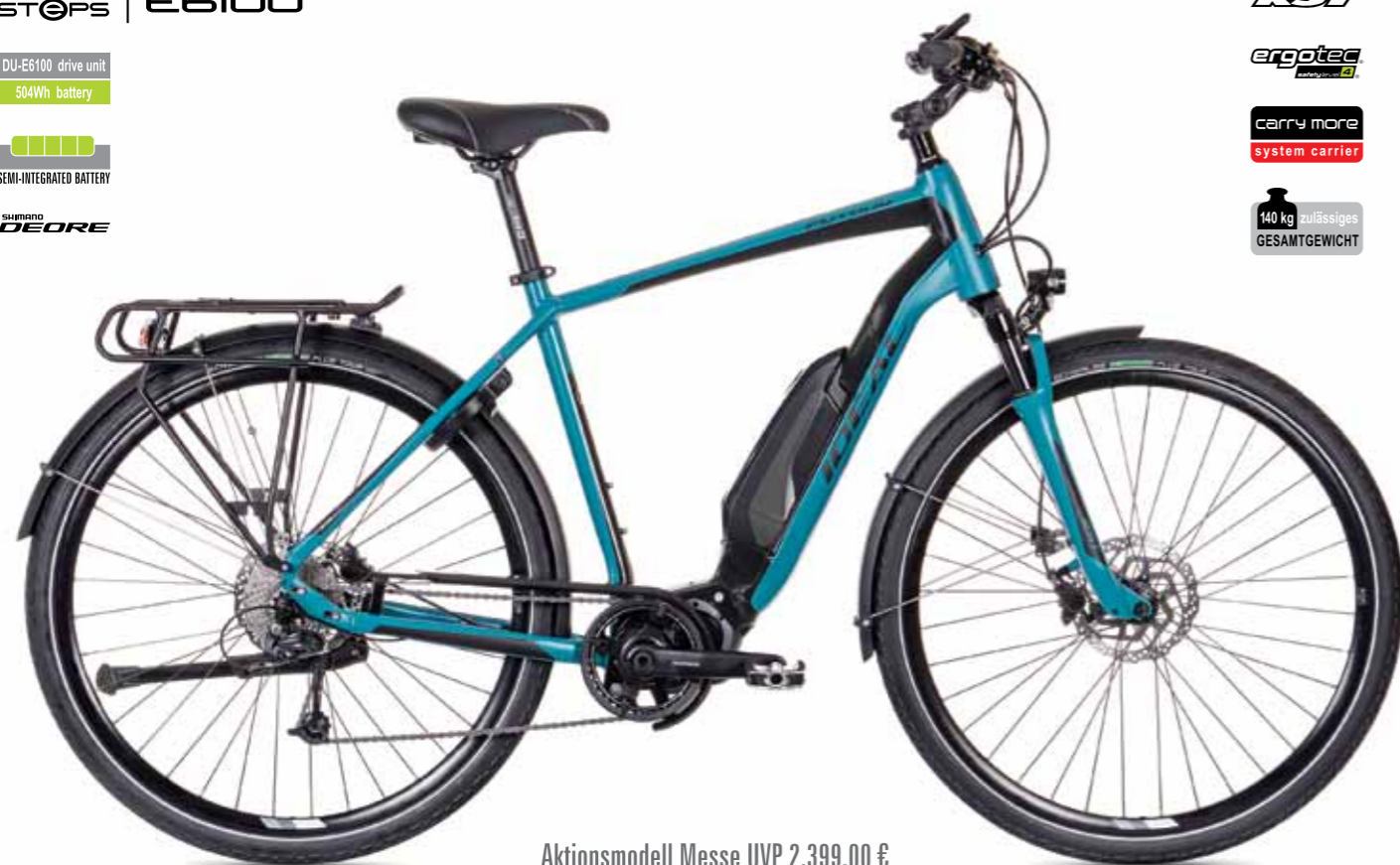
Aktionsmodell Messe UVP 2.399,00 €