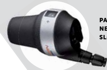
PASSENDER 5-GANG NEXUS REVO SHIFTER SL-C7000-5

Insbesondere beim Schaltvorgang können deutlich größere Lasten toleriert werden, sodass diese Nabe als spezifische E-Bike Nabe spürbare Vorteile für den Fahrer bringt. Die Gangabstufung wurde für den E-Bike Einsatz optimiert. Die leichten Gänge wurden dabei reduziert, zu Gunsten der mittleren und hohen Gänge, die gerade für eine Fahrt mit Motorunterstützung wichtig sind.