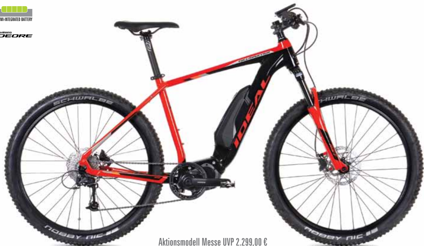
Aktionsmodell Messe UVP 2.299,00 €