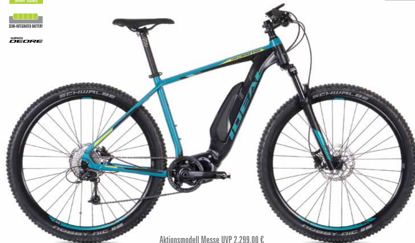
Aktionsmodell Messe UVP 2.299,00 €