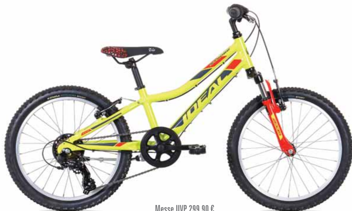
Messe UVP 299,90 €