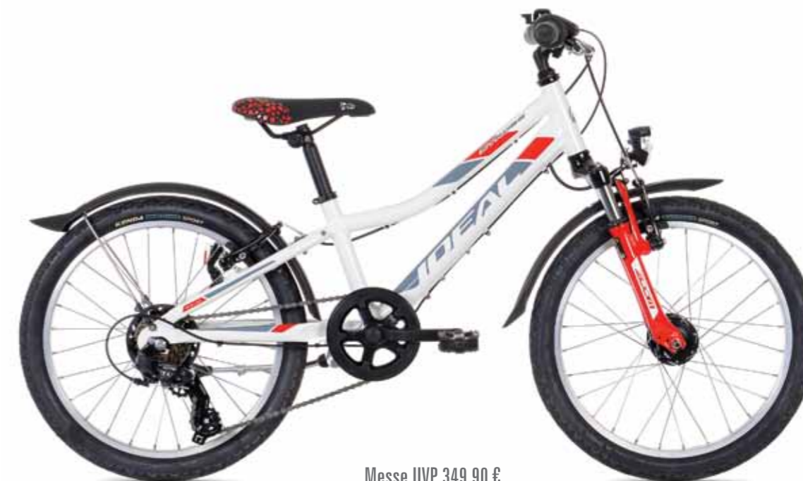
Messe UVP 349,90 €