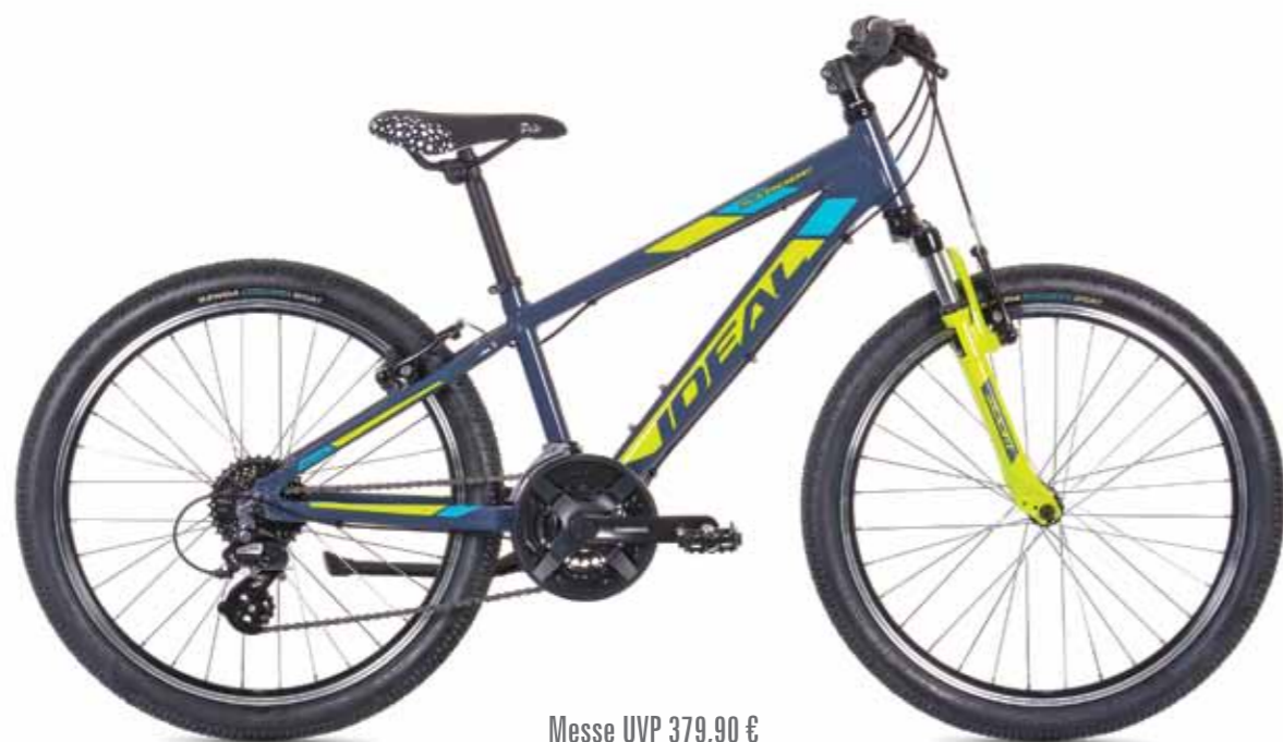
Messe UVP 379,90 €